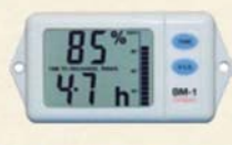
バッテリー管理モニター