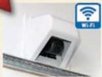
Wi-Fi 無線式バックカメラ

スマートフォンまたはタブレットに専用のアプリをインストールするだけで使える簡単接続バックカメラ。