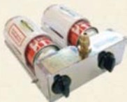
カセットガス供給器