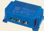
ブースター走行充電器

AC電源がなくても、太陽光でバッテリー充電を可能にするアイテム。チャージコントローラー付でしっかり充電制御。