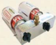
カセットガス供給器