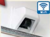
Wi-Fi 無線式バックカメラ

スマートフォンまたはタブレットに専用のアプリをインストールするだけで使える簡単接続バックカメラ。