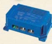
ブースター走行充電器

AC電源がなくても、太陽光でバッテリー充電を可能にするアイテム。チャージコントローラー付でしっかり充電制御。