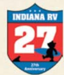
27 th Anniversary ロゴステッカー

日本でのトレーラー利用環境では活躍する天井ファン。フード付きで雨天でも利用できるすぐれもの。リモコン付で簡単操作。