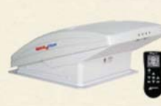
マックスファンDX(リモコン付)

AC電源がなく、太陽光も利用できない状況でも、けん引車から供給される12Vメイン電源でバッテリーの充電を可能にするお助けアイテム。