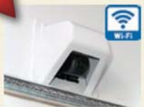
Wi-Fi 無線式バックカメラ

スマートフォンまたはタブレットに専用のアプリをインストールするだけで使える簡単接続バックカメラ。