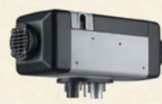
灯油式FFファンヒーター