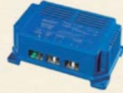
ブースター走行充電器

AC電源がなくても、太陽光でバッテリー充電を可能にするアイテム。チャージコントローラー付でしっかり充電制御。