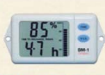
バッテリー管理モニター